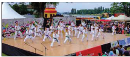
Kinder und Jugendliche des Karate Dojo Breisach beim Soundkarate auf der Rheininsel.